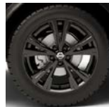
Черные 18" диски